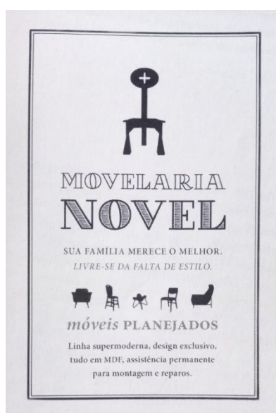
Figura 2 - Móveis Planejados

Levando em conta as argumentações anteriores, a ligação entre a personagem e suas experiências aparecem com muita força na narrativa de Quarenta dias , a narradora-protagonista não só inclui fontes de escrita – considerando a atividade diletante de ser leitora – mas também fontes de outras linguagens, e de outras personagens. Na sequência, outra característica que dá voz para a figura ficcional são os valores afetivos, a coragem de falar por afeto em sua existência, deixando-se tocar pela linguagem do outro no caminho, faz ser esse outro uma pessoa desconhecida ou algum familiar por quem nutre afeto.